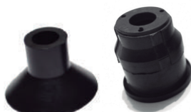
Ventosas y Tulipas